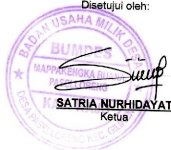
SATRIA NURHIDAYAT Ketua